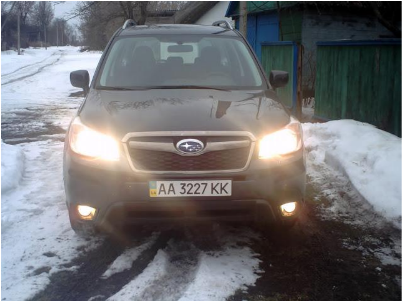
Subaru Forester 2013

Начнём с описания внешнего вида: по сложившимся первоначальным ощущениям хочу отметить, что Forester 2013 подрос, причём визуально «вырос» во всех направлениях, и когда садишься в него, моментально понимаешь, что он подрос ещё и в высоту. Это уже не «паркетник», а полноправный джип. Попав в недра салона, сразу хочется сравнить его с квартирой на колёсах - настолько всё сделано гармонично и как-то фундаментально. Кроме того, салон, по ощущениям, также подрос. Водительское сиденье forester 2013 оборудовано в базе электрорегулировками, которые удобны, понятны и рассчитаны на водителя любой комплекции. Регулировка руля в двух направлениях добавляет гармоничности и позволяет устроиться в самом удобном положении. Я закрываю дверь и обращаю внимание на удобно изменённую внутреннюю дверную ручку, являющуюся продолжением подлокотника. Мелочь, а приятно, спасибо дизайнерам! На водительском подлокотнике появилась новая кнопка – электрический привод, естественно, с электрорегулировками, складывающий наружные зеркала.